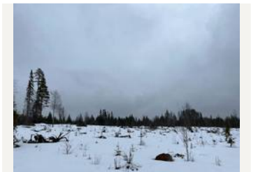
Kuvio 47 (Tuovivaara)