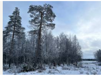
Kukkarokosken rantaa/kuvio 51