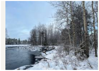
Kukkarokosken rantaa/kuvio 51