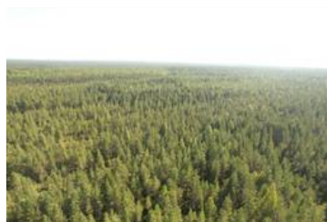
Dronekuva kuvion 4 päältä kuviolle 7