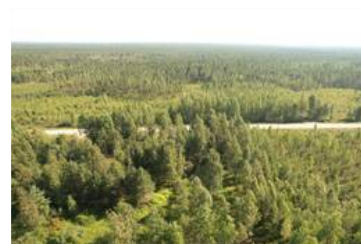
Dronekuva kuvion 17 päältä kuviolle 16