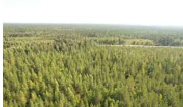
Dronekuva kuvion 3 päältä kuvion 12 suuntaan