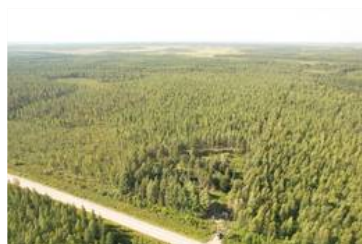
Dronekuva kiinteistöstä koillisesta