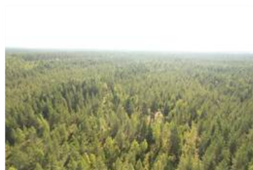
Dronekuva kuvion 8 päältä