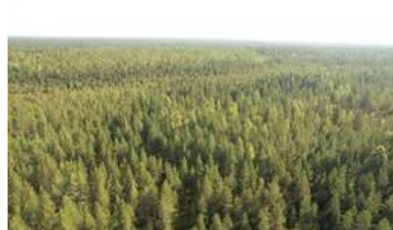
Dronekuva kuvion 9 päältä kuviolle 8 itään