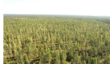
Dronekuva kuvion 10 päältä itään