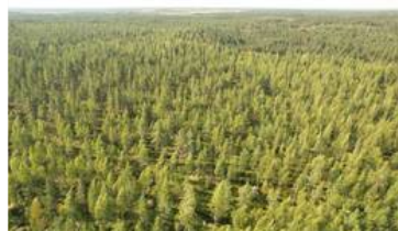
Dronekuva kuvion 1 päältä