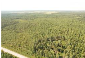
Dronekuva 2 kiinteistöstä koillisesta